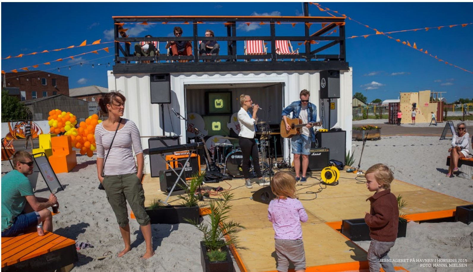
JERNLAGERET PÅ HAVNEN I HORSENS 2015